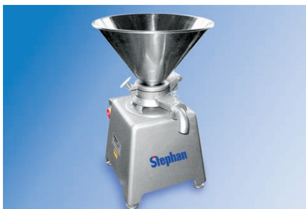
MC 10/12/15 Für Handwerk, kleine Chargen und Produktentwicklung