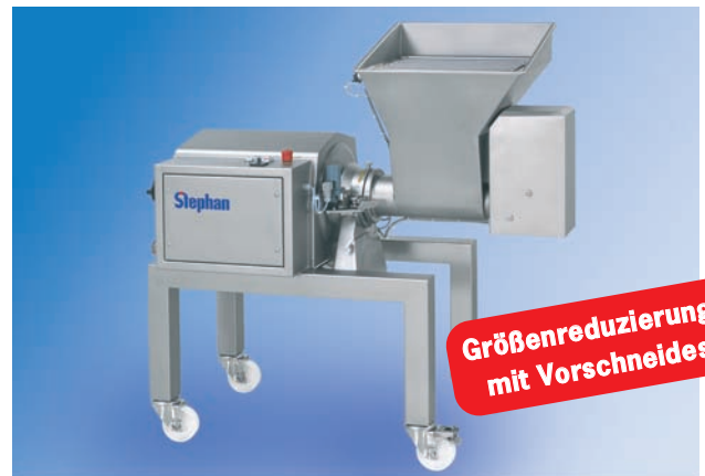
MCH K Feinst- und Grobzerkleinerung von trockenen, druckempfindlichen sowie gefrorenen Produkten