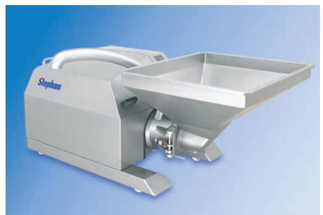
MCH u. MCH-D Hochleistungszerkleinerer für Fleisch, Fisch und Babynahrung