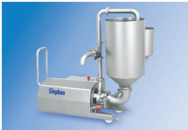
MCH 10 Emulgier- und Mischmaschine