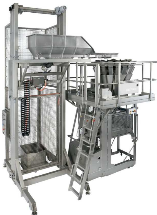
Komplet mobilt system inkl. integreret platform. Høj lift for tømning af Eurobin i integreret forrådsvibrator, der fører produkt til vejemaskinen.

Das Zuführsystem ist auch mobil und absenkbar und lässt sich zusammen mit der Waage wegrollen. Das Wiegesystem verträgt aggressive Reinigungs- und Desinfektionsmittel.