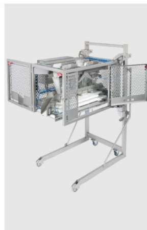
Mobilt fyldeværktøj. Let at rulle væk for rengøring, eller hvis man har brug for at frigøre plads ved pakkeudstyret.

Hohes Hebe-/Kippgerät für die Entleerung des Eurowagens an einen integrierten Vorratsvibrator, der das Produkt an die Waage zuführt.