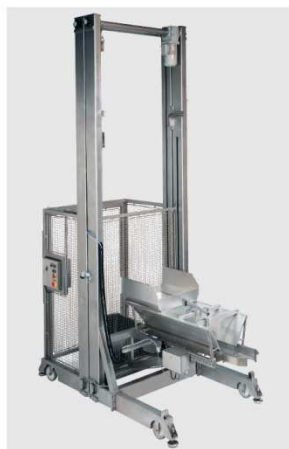
Høj lift for tømning af Eurobin i integreret forrådsvibrator, der vibrerer produkt til vægten.

Ein komplettes Mobilsystem mit integrierter Plattform. Hohes Hebe-/Kippgerät für die Entleerung des Eurowagens an einen integrierten Vorratsvibrator, der das Produkt an die Waage zuführt.