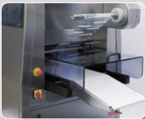
Hoher Standard: Restfolienaufwicklung und Auslaufband. High standard: film remnant rewinder and discharger belt.